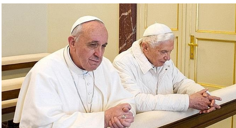
Saint Père François et sa Sainteté Benoît XVI

Ces dernières semaines ont été riches en événement pour la Sainte Eglise. La renonciation du Saint Père Benoît XVI le 11 février a pris tout le monde de court, chrétien ou non ! Depuis son élection, notre Saint-Père avait agi en serviteur, serviteur de la Vérité, serviteur de la