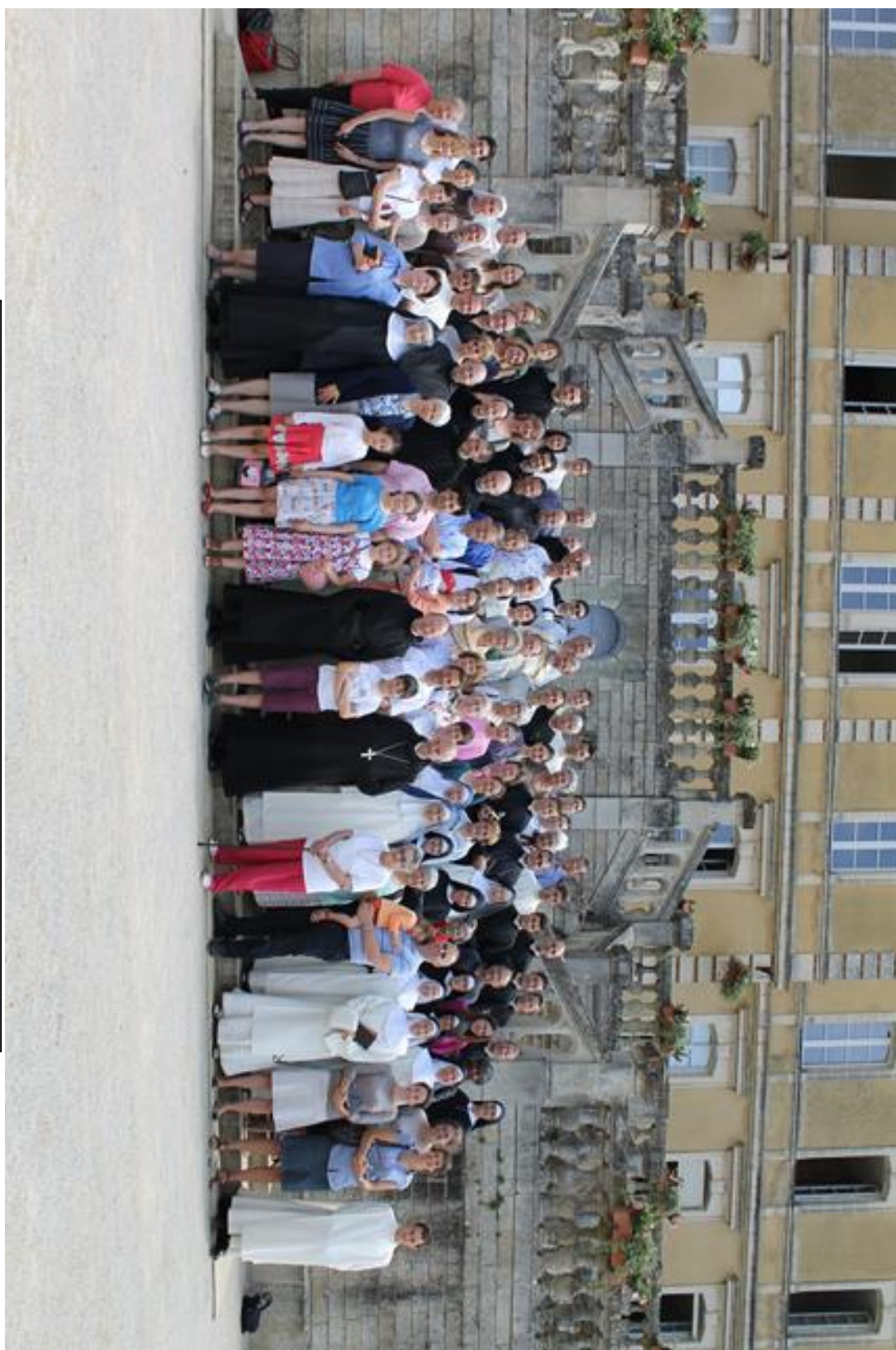
Stagiaires (73e session de formation grégorienne)