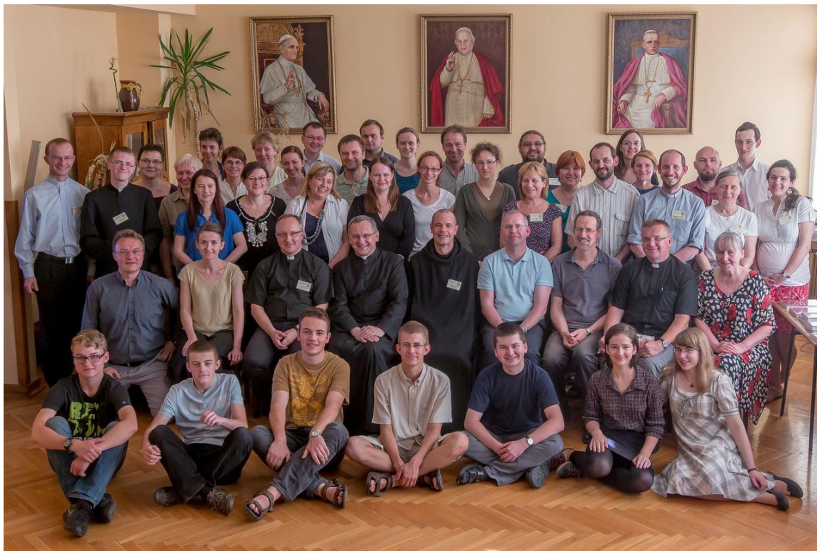
Stagiaires (3 e session au Séminaire de Lodz)