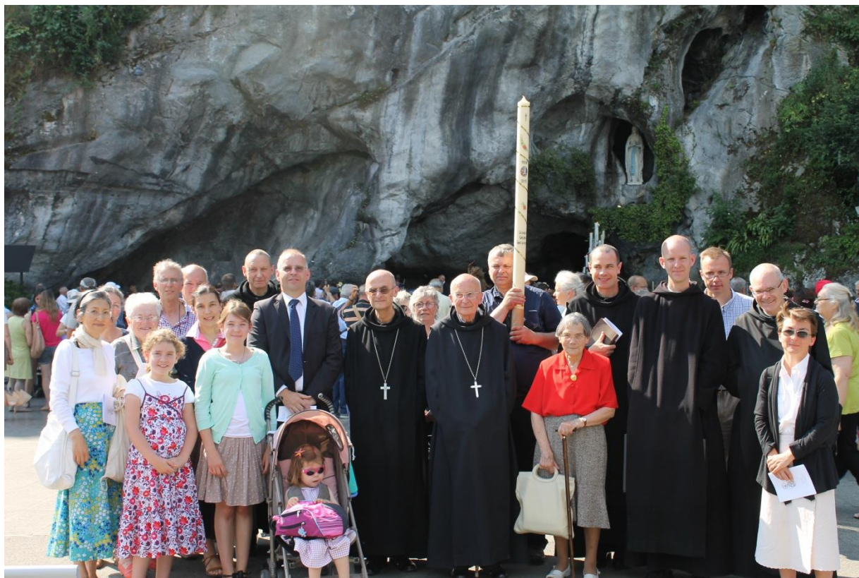
Petit groupe de la Schola